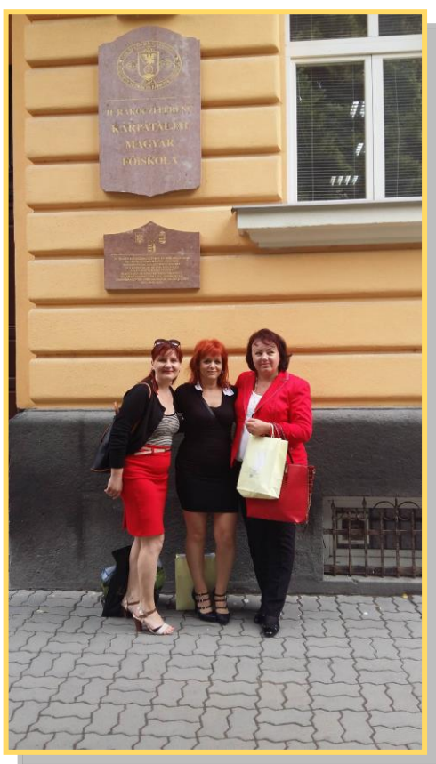
A főiskola épülete előtt

Ukrajnába vezető utunk kissé kalandosra sikerült a tömegközlekedési összekötetés hiányossága miatt, de végül a kedves és barátságos fogadtatásnak köszönhetően, melyben részünk lehetett Beregszászon, homályba merültek az utazás okozta izgalmaink.