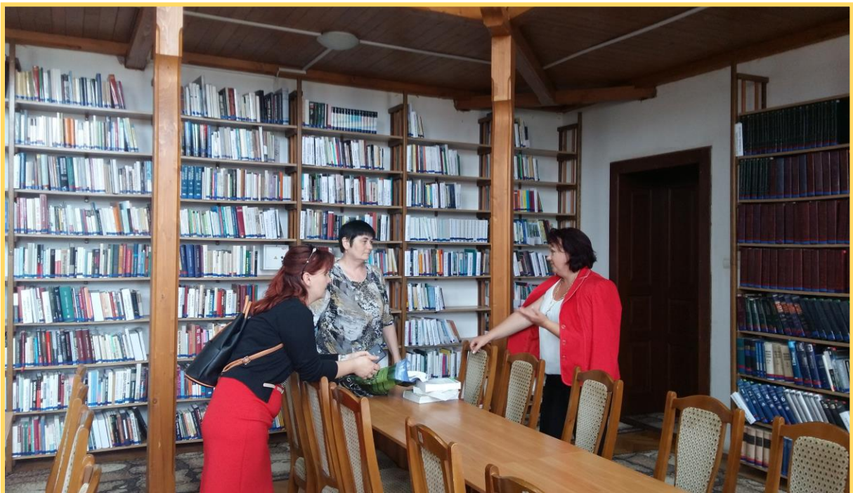
A központi olvasóterem

Harmadnap megtekinthettük a több mint 75 000 kötettel rendelkező Apáczai Csere János Könyvtár részlegeit is.