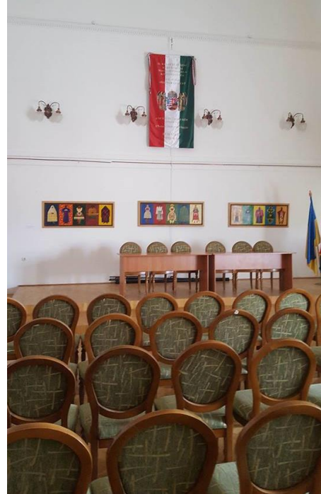
A főiskola tanácstermében és aulájában

Vendéglátóink mindennapra tartogattak látnivalót és megbeszélnivalót számunkra.