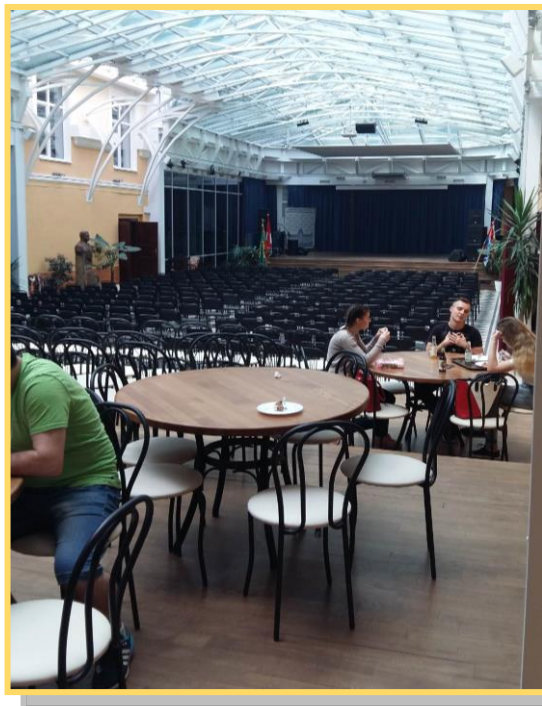
Az újonnan épült átrium

Vendéglátóink mindennapra tartogattak látnivalót és megbeszélnivalót számunkra.