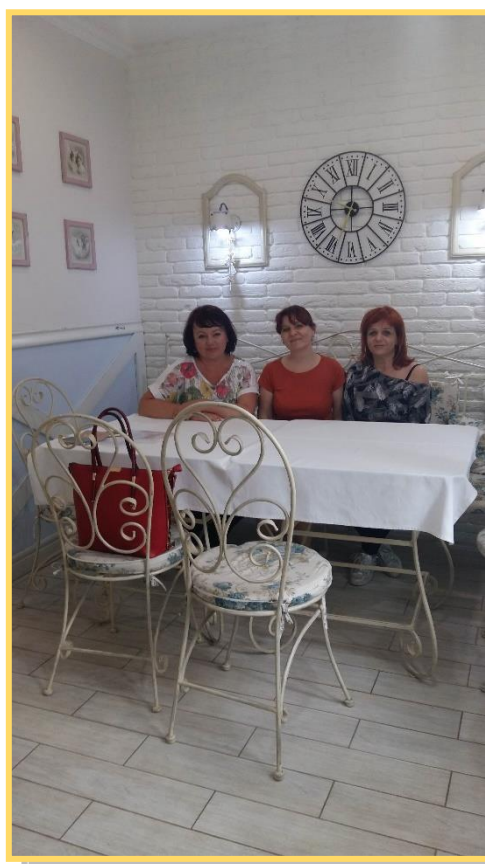
A szálloda éttermében