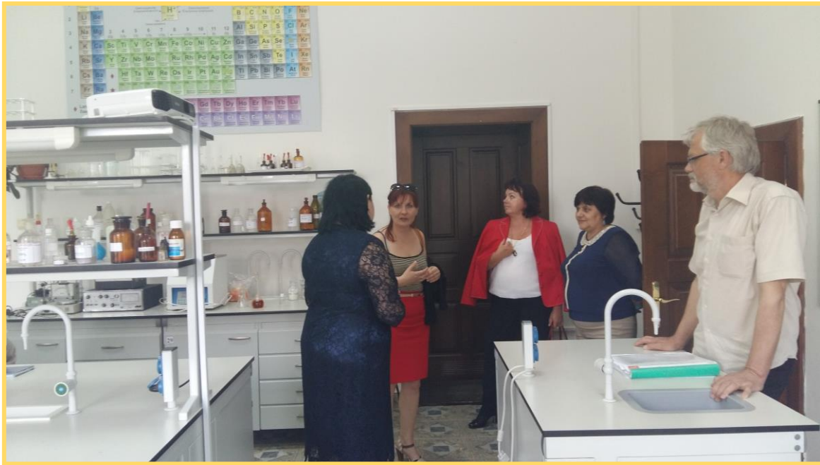
A Kémia és Biológiai Tanszék laboratóriumaiban

Második nap betekintést nyerhettünk a főiskola Biológia és Kémia Tanszékének 6 szaktantermébe és jól felszerelt modern laboratóriumaiba is.