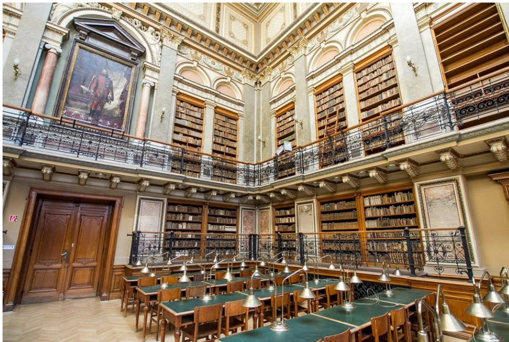
A Bölcsészettudományi Kar könyvtára lélegzetelállító látványt nyújt.