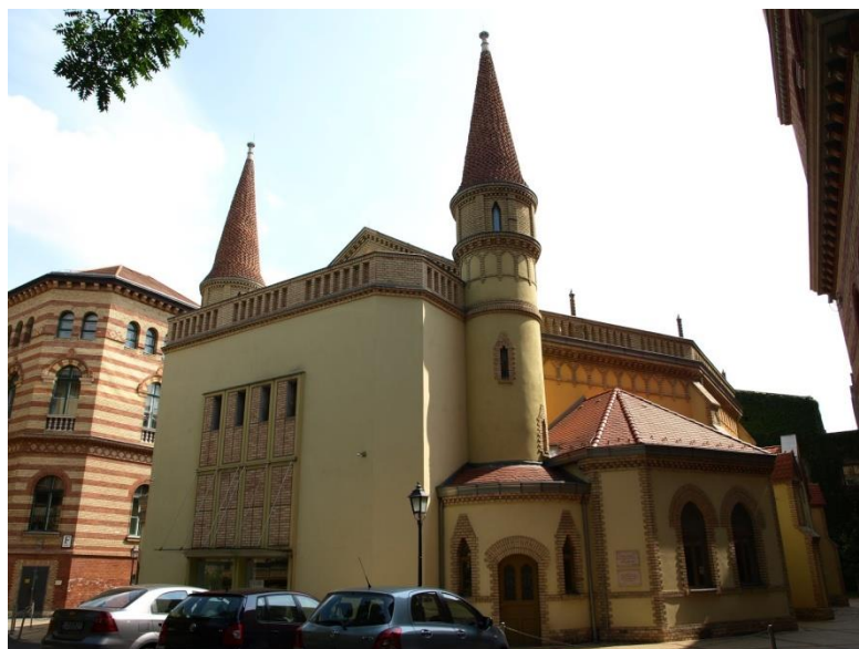
Az egyik legszebb és legérdekesebb épület az ELTE-n számomra a gólyavár volt.