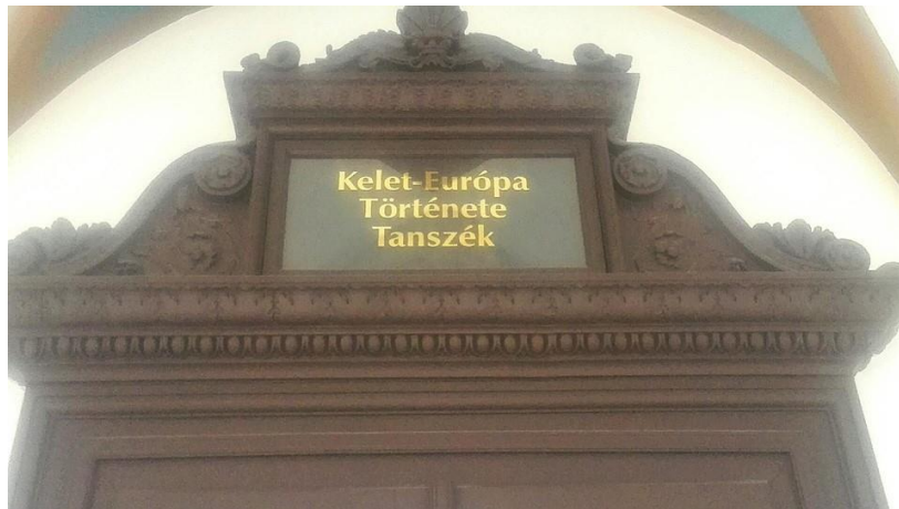
Egy tanteremajtó a sok közül.