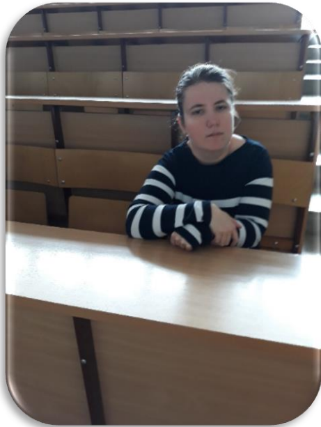
Az egyetem előadótermében

Az ERASMUS+ hallgatói mobilitásnak immár másodszer lehettem a részese. A félév során számos új tapasztalattal, ismeretekkel gazdagodtam, amelyeket – bízom benne –, hogy a jövőben kamatoztatni is tudok. Az egyetemen töltött idő alatt, ha nehézségeim adódtak, az egyetem alkalmazottaihoz, tanáraihoz bátran fordulhattam, megoldást mindig találtunk. Összességében az ERASMUS+ hallgatói mobilitást mindenkinek csak ajánlani tudom! 😊