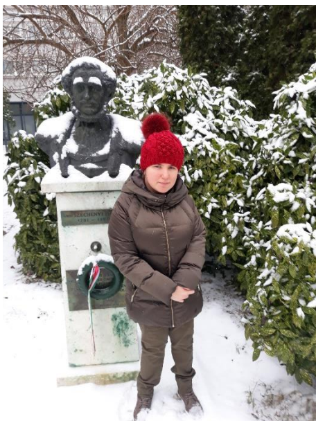
gróf Széchenyi István szobra előtt